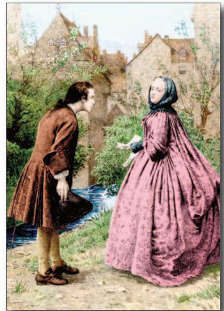
Incontro di Jean-Jacques Rousseau e della sua amica Madame de Warens, 21 marzo 1728.

L'educazione delle donne considerata come un problema non solo pedagogico, ma anche etico, religioso e di costume precede, dunque, di gran lunga, nel tempo, l'affermarsi in termini socialmente significativi della diffusione