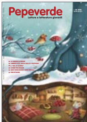
Illustrazione di copertina di Valeria Troncarelli